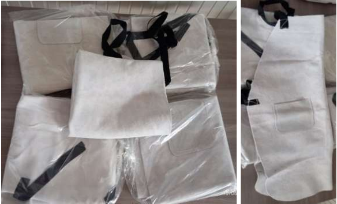
Peto guadañador en carnaza