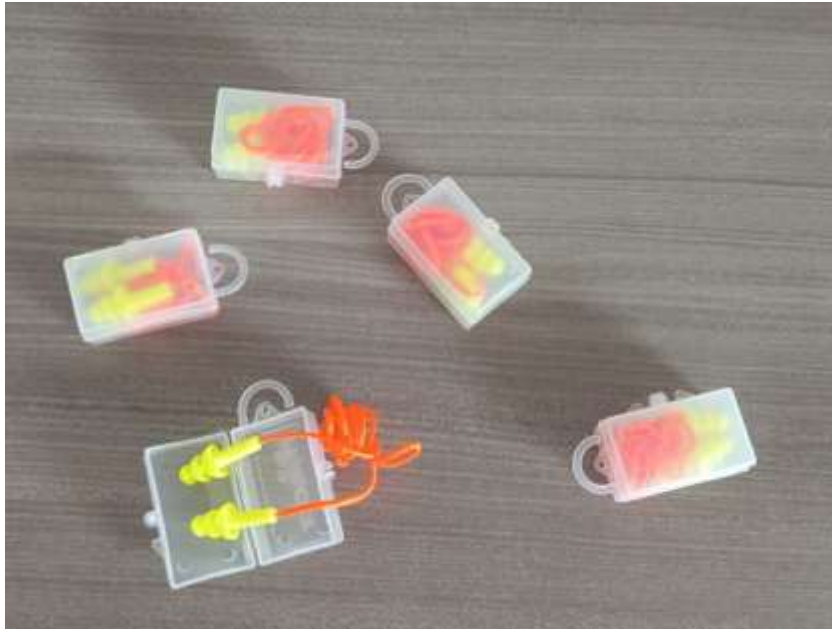
Protector auditivo tipo Tapón Reutilizable Cordón