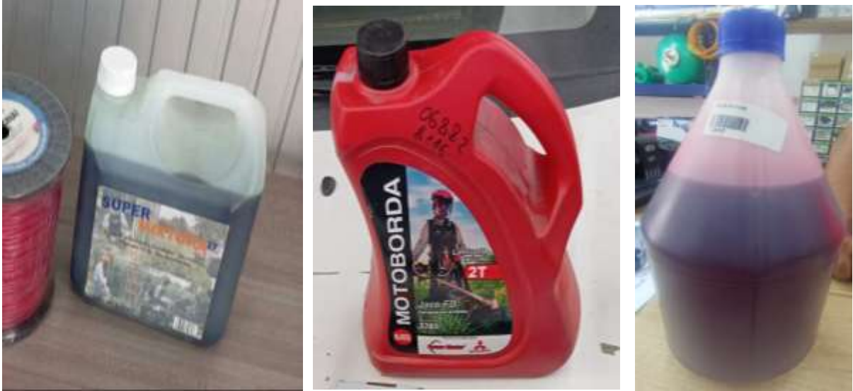
Aceite 2 tiempos para guadañas y motosierras