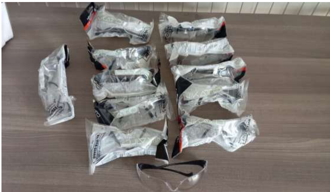
Gafas de seguridad lente claro