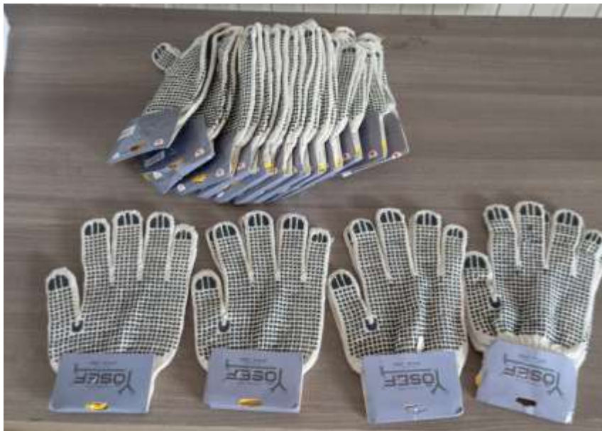
Par de guantes de hilo con puntos de PVC