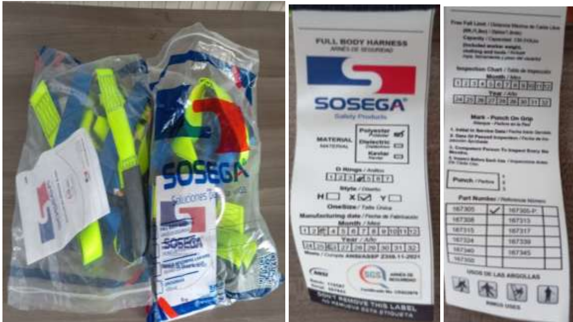
Arnés de seguridad en "X" para trabajo en alturas 4 argollas