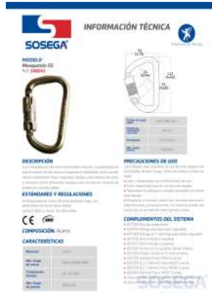
Gancho y/o mosquetón de seguridad de cierre con torsión en acero forjado con su respectiva ficha tecnica