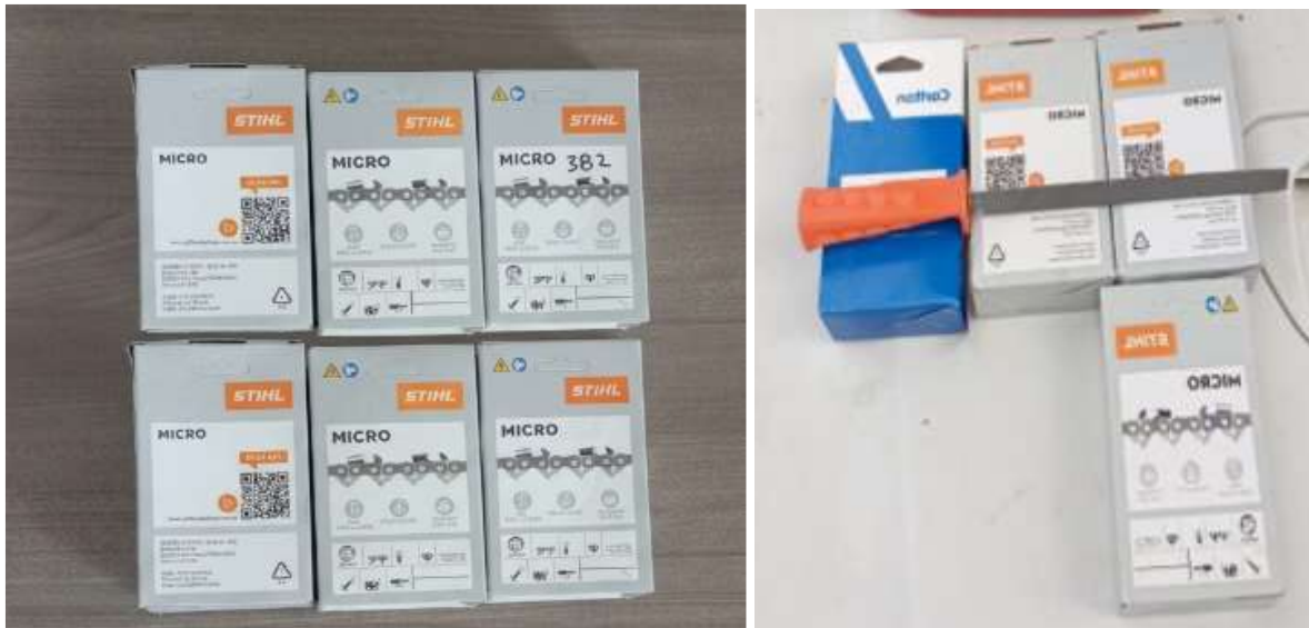
Cadenas de aserrado para motosierra (170 – 230 – 382).