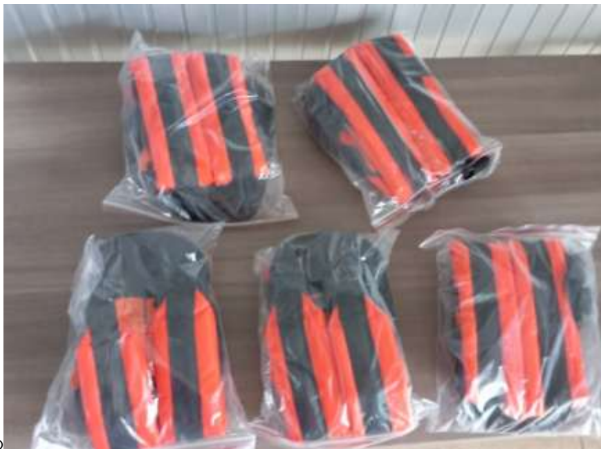
Arnés para guadaña