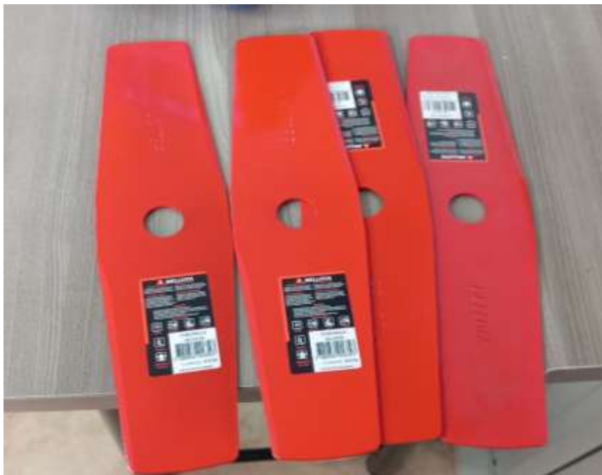
Repuesto de cuchilla para guadaña de referencia de eje recto 2 tiempos 43CC, motor 143R-II, Potencia 1.5Kw, (2 puntas)