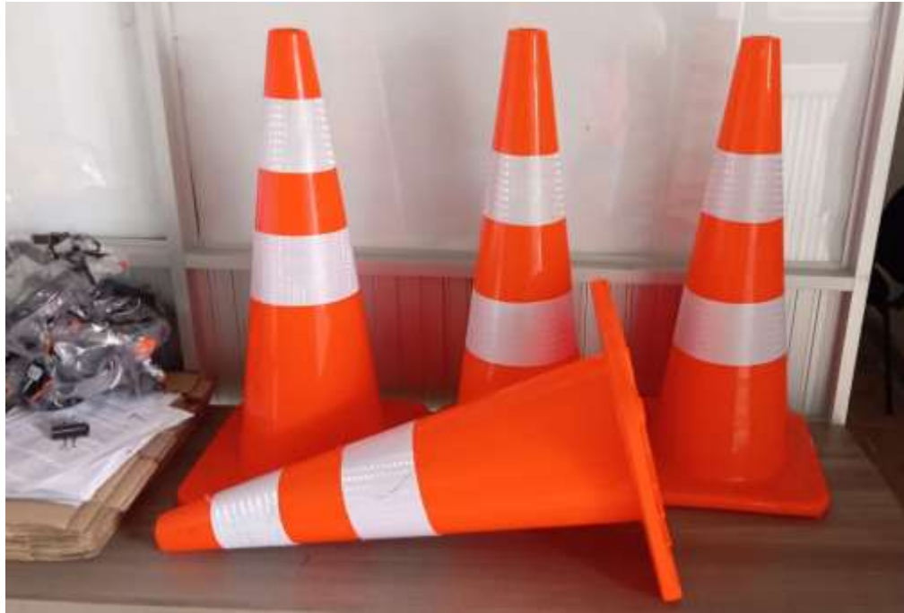
Cono vial PVC grande (70cm) 2 cintas reflectivas