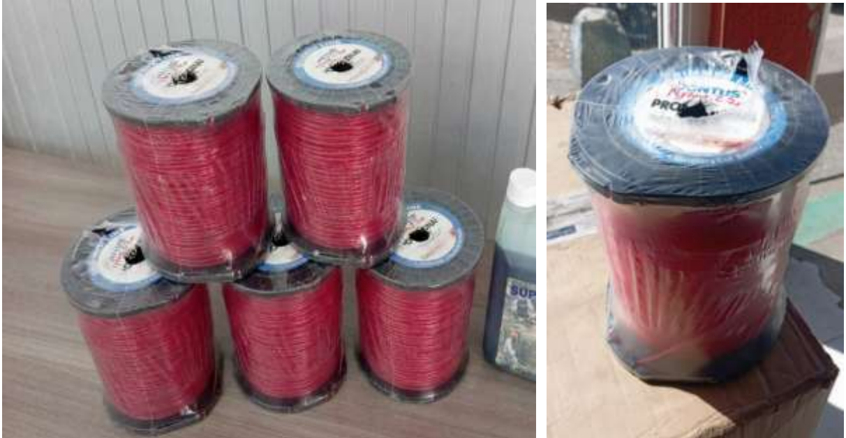
Carretes de nylon