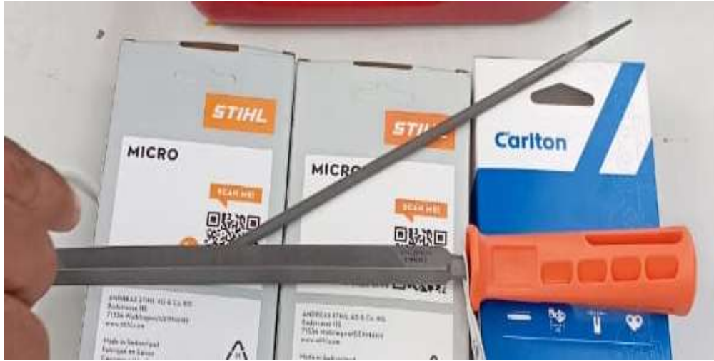
Lima triangular y redonda 7/32