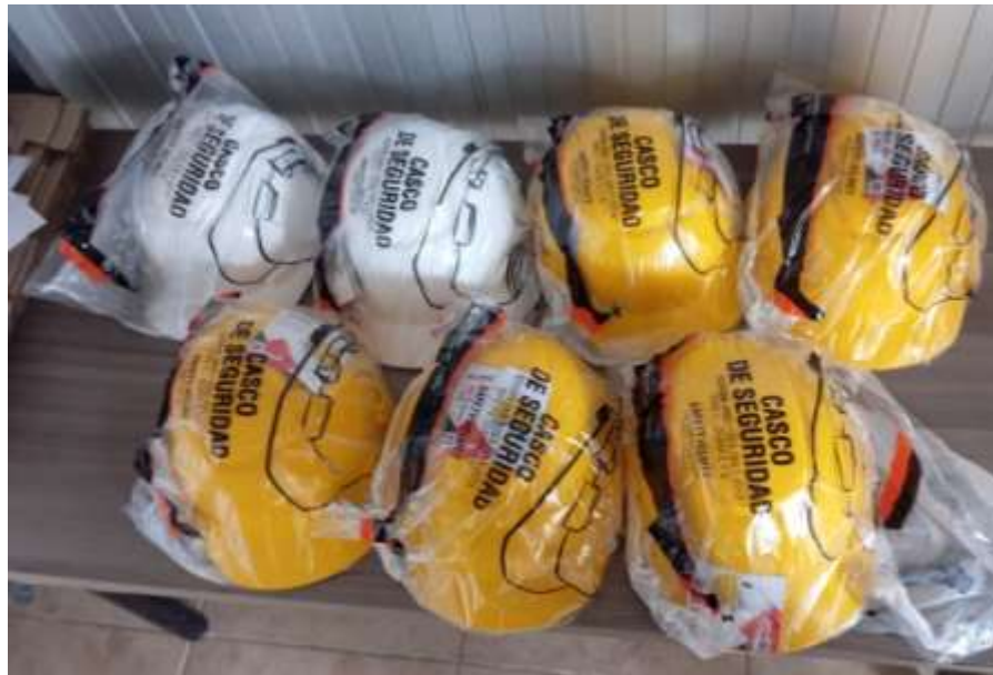
Casco de seguridad color blanco y amarillo